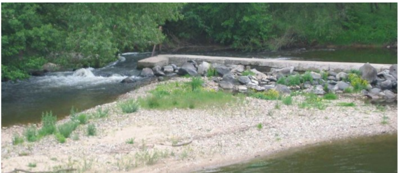
Figure 199 : Vestiges rive droite du seuil de Vézézoux.